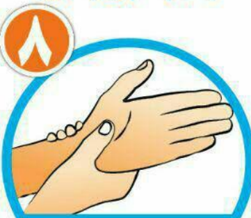
دور مچ هر دو دست را بشویید.