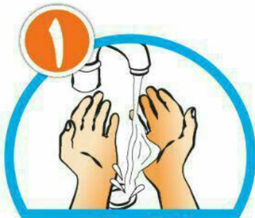
دست‌ها را خیس کرده و بعد آن‌ها را صابونی کنید.

وزارت بهداشت، درمان و آموزش پزشکی معاونت بهداشت مرکز مدیریت پدیده‌های واگیر