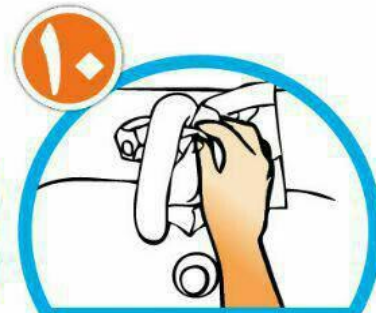
با همان دستمال شیر آب را ببندید و دستمال را در سطل زباله بیاندازید.