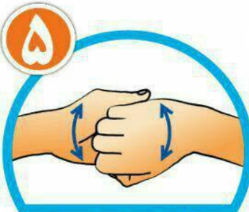
نوک انگشتان را در هم گره کرده و به خوبی بشویید.