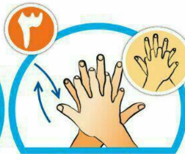
بین انگشتان را در قسمت پشت بشویید.