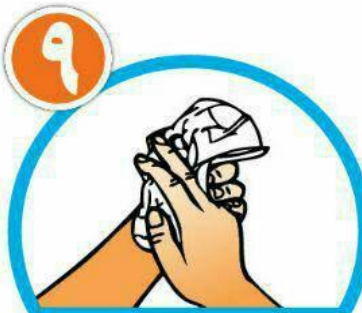
دست‌ها را با دستمال خشک کنید.