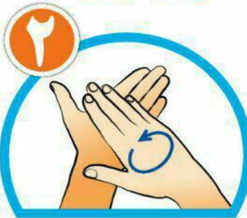
کف دست‌ها را با هم بشویید.