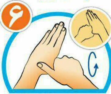
شست‌ها را جداگانه و دقیق بشویید.