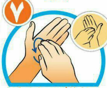
خطوط کف دست را با نوک انگشتان بشویید.