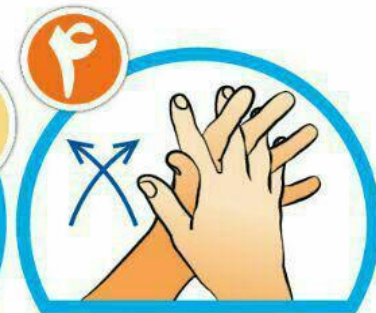
بین انگشتان را از روبرو بشویید.